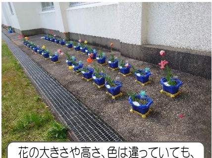
花の大きさや高さ、色は違っていても、みんなのびていこうとしているね