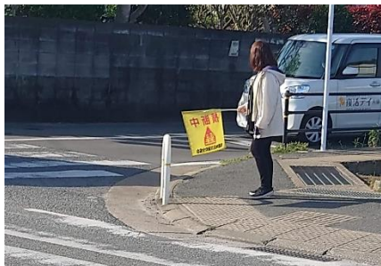
みんなの安全を守る心はおうちの方も地域の方もみんないっしょ