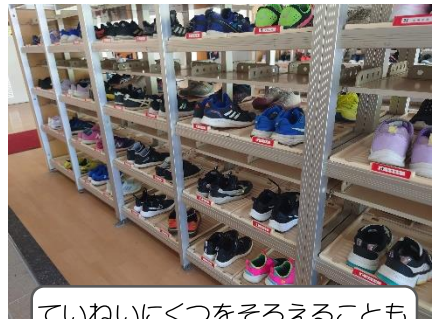
ていねいにくつをそろえることも心をそろえていくんだよ