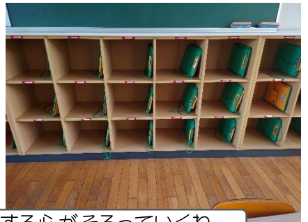
きれいに並んだ教室の机やたなの中。みんながのびていこうとする心がそろっていくね