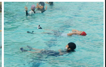
ペットボトルを使うと浮くことができます。