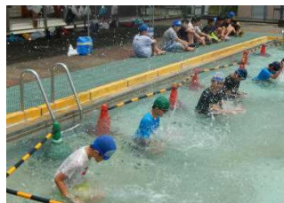
小プールを使って水に慣れます。