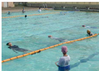
背浮き。力を抜くと仰向けでも浮きます。