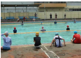
密を避けるため半数ずつ入水しています。

今年は水に慣れることや着衣水泳を中心に指導しています。子どもたちは服を着たまま水に入ると動きにくいこと、力を抜くと水に浮くことができることを体験しました。