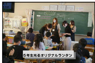
5年生光るオリジナルランタン