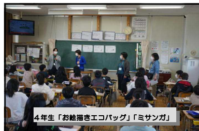
4年生「お絵描きエコバッグ」「ミサンガ」