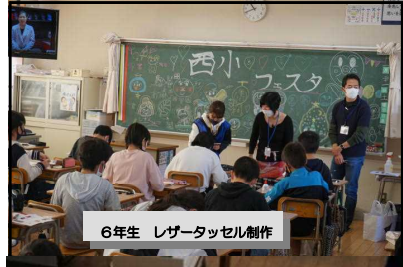
6年生 レザータッセル制作