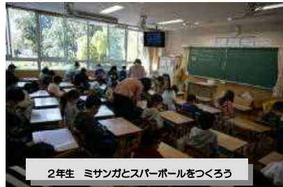
2年生 ミサンガとスパーボールをつくろう