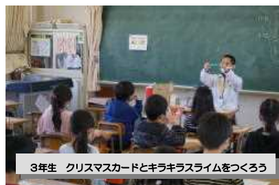
3年生 クリスマスカードとキラキラスライムをつくろう

等の活動を行い、保護者の皆様にご指導いただきながら、子供達は、たいへんたのしい時間をすごさせていただきました。