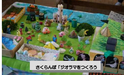
さくらんぼ「ジオラマをつくろう」