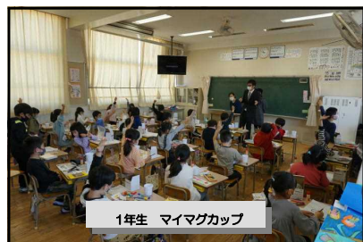
1年生 マイマグカップ