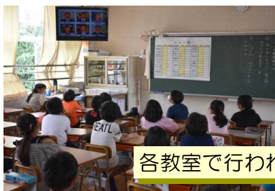
各教室で行われた学校再開式の様子

何かと至らぬ点もあるかとは存じますが。保護者の皆様方にも、様々な点でご協力いただき、子どもたちのために努力していく所存です。今後とも志免西小学校の教育活動にご支援とご協力をお願いいたします。