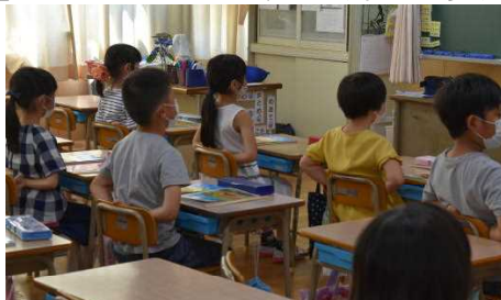
西っ子タイム「西小10のやくそく」