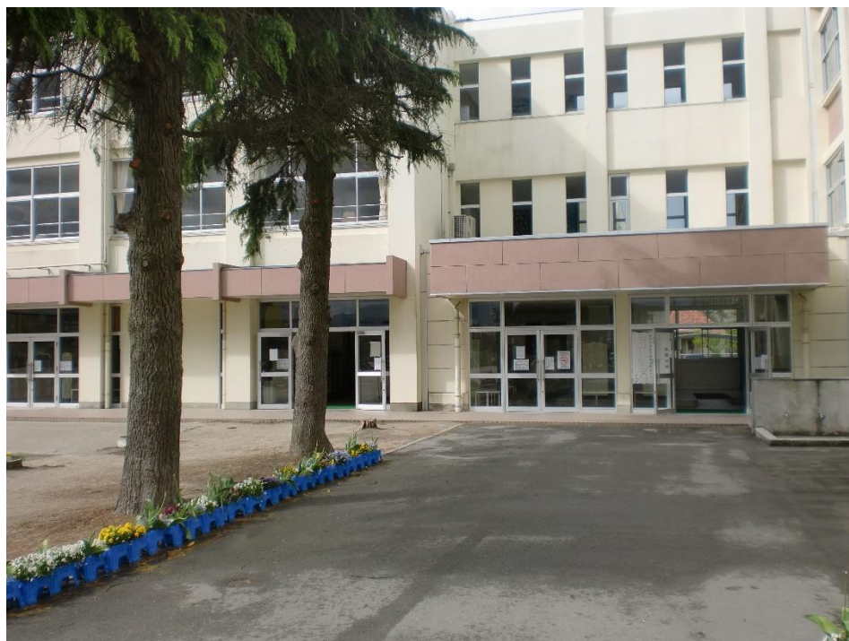
【新1～5年生用くつばこ：学校玄関を通り過ぎた奥】