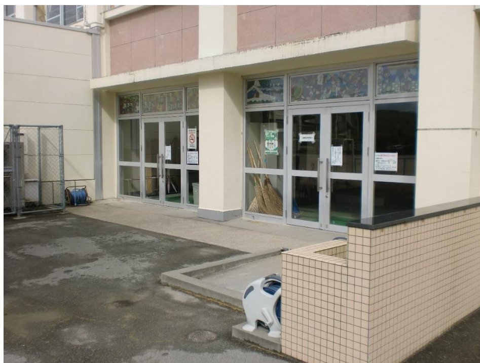
【新6年生用くつばこ：正門近く、保健室横】