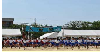
3年生 踊って魅せます～3年生のキズナ～