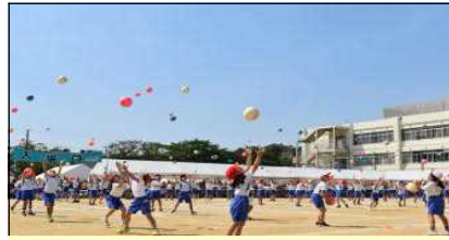
2年生 ゴール！平和な令和！