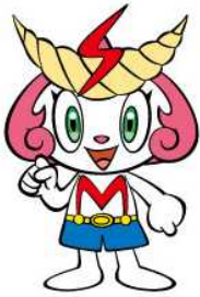
志免町公式キャラクター 「シメッチャ」

志免西小学校には、子どもたちによるイメージキャラクターがいます。その名は「ミライマン」。名前の由来は、「今(イマ)のがんばりが未来をつくる。未来(ミライ)の夢が今を支える。」、ミライとイマで「ミライマン」です。