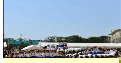
6年生 信 ～支え合って～