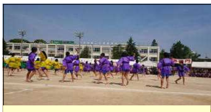
4年生～まほろば 西っ子元気隊～