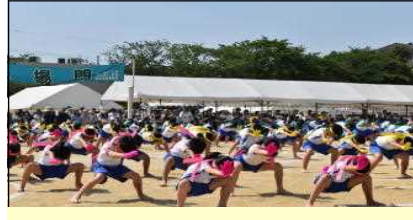
5年生 Let's 5！西小TRIBE