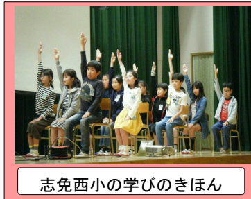
志免西小の学びのきほん

4月27日(金)、1年生から6年生の全校が揃っての本年度初めての 全校朝会 を行いました。1200名を超える子どもたちが体育館に入っても、話をしっかりと聴く姿が見られ、どの学級・どの学年でも「よく見る」「よく聴く」「よく考える」指導が徹底されていることをうれしく思いました。この指導は、全校朝会の中でも「志免西小の学びのきほん」として、6年生の代表による役割演技(左下写真)を通して、確認されました。この学びの基本が、子どもたち一人一人に意識され、“ 確かな学び ”につながるよう、その積み上げを図っていきたく思います。私からは、始業式で話した「思いやり(思いをやる)」の話に付け加えて、以下のような『思いやり算』(下中央図)を使った『他者(友達、先生、地域の方など)との交流』を通して、“ つながり ”ながらの活動を大切に一年にしてほしいと子どもたちに話をしました。