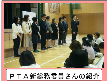
PTA新総務委員さんの紹介

翌日の28日(土)の学習参観では、 校内に溢れんばかりの保護者の皆様 にご来校いただき、 本当にありがとうございます 。また、PTA総会には、町議会議員様をはじめ、町内会長様、民生委員・児童委員様もご来賓として参加していただき、 子どもたちを多くの保護者、地域の皆様に見守っていただいていることに心から有難く感じました 。このように学校の教育活動やPTA活動に関心を寄せ、参加していただくことは、 家庭の教育力、地域の教育力を高めていくことになり、引いては「家庭の宝」「地域の宝」である子どもを育てることにつながっていく と考えます。今後とも、学校行事やPTA活動等へのご参加、ご協力をよろしくお願いいたします。