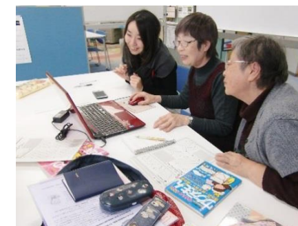
パソコン作業もちょっとしたアドバイスでよりスムーズに！

団体広報に関するご相談は、これからも随時受け付けます。お悩みに合わせて対応しますので、お気軽にご利用ください。