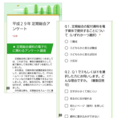
↑ アンケート画面（スマホ版）