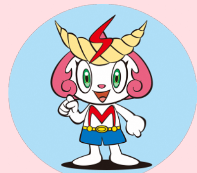
志免町公式キャラクター シメツチャ