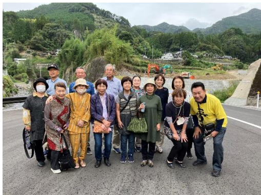
▲被災地復興(久留米・東峰村)応援ツアー (R5.10.7)