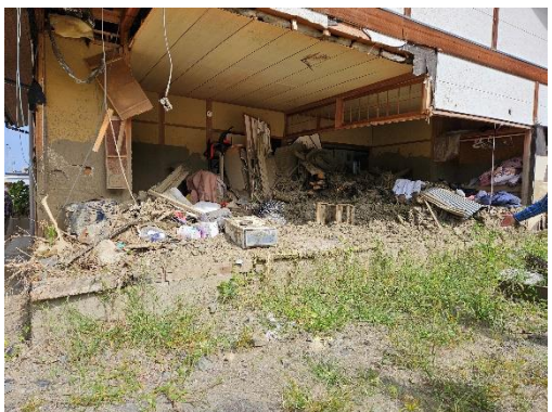
▲久留米 竹野地区 駐在所