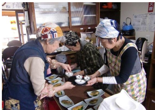
▲認知症カフェ「たからちゃん」での活動風景（2018年）