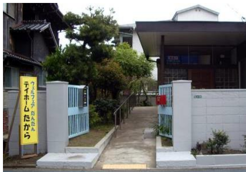
▲一軒家を改装したデイホームたからは、まるで自宅のような雰囲気です。利用者の皆さんを和ませてくれました。