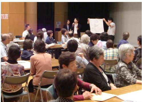
▲つどい場をテーマにした講演会（2017年）