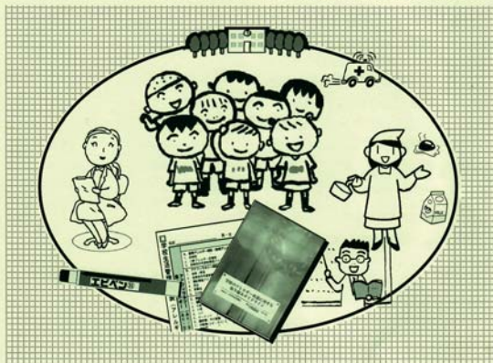
▲日本アレルギー学会副誌