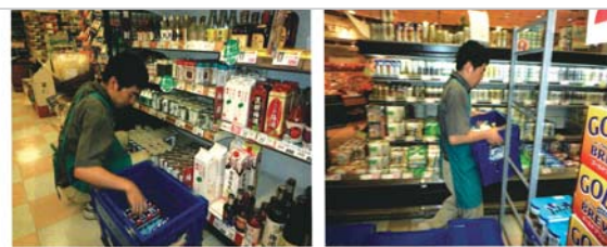
障害者雇用について事業所からの声

障害者を雇用したからといって何か大きく変わった、ということはありません。仕事をすにあたって障者だからといって特別扱い等はしていません。しかし、障者の特性を把握したうえで出来るだけ分かりやすく、また、安全な作業を提供するように配慮しています。 障者を雇用して感じたことは、障者である事でできる仕事だろうか、お互いに困ることもあるだろうな等の考えがありました。ゆっくり時間をかけて教えていくことで見違えるほど成長していきまし。それと同時に不安も解消されて行きました。コミュニケーション等のとり方については、ジョブコーチに相談しながらクリアしていきまし。 今では仕事も早く、当店の大切なスタッフの一員として働いてもらっています。旅行に行きたい等プライベートな事も話してくれるようになり、周りのスタッフとも仲良く働いてくれています。