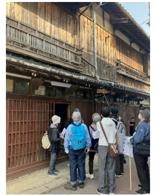
▲志免町近郊の魅力ある歴史を伝えます！