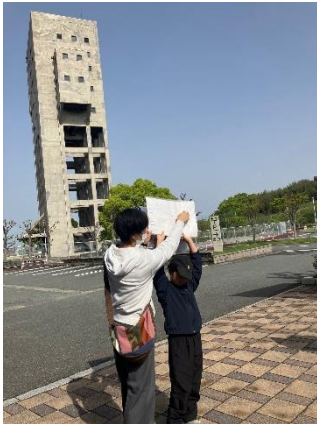
▲志免町の歴史を巡るウォーキングを定期的で開催しています