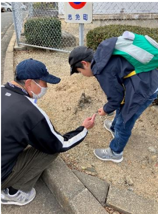
▲炭鉱の歴史を次世代に伝えます