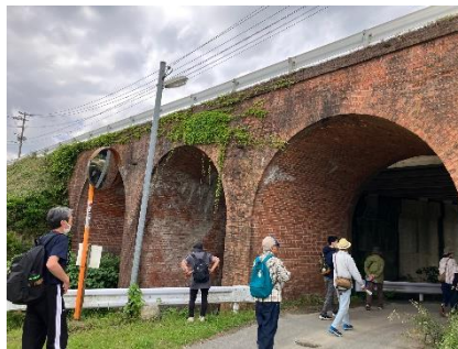
▲旧九州鉄道城山三連橋梁を見学

神話をはじめとする神社の歴史を学ぶ事から発足した集まりでしたが、対象を歴史全般に広げて古代から中世、近代にかけての志免町とその周辺の歴史を学ぶ活動をしています。