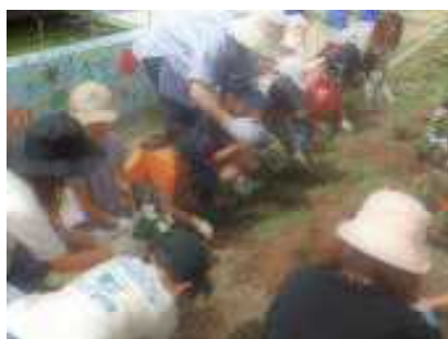
【花植えボランティア】

中央っ子サポーターズや地域の方のサポートを受け、学校の教育活動が充実したものとなっています。保護者の方、地域の方との関わりを子ども達は喜び、活動を楽しんだり学習への自信をつけたりしています。ご支援いただいていることに感謝いたします。これからも様々な場面で学校にお越しいただき、サポートしていただきますようよろしくお願いいたします。