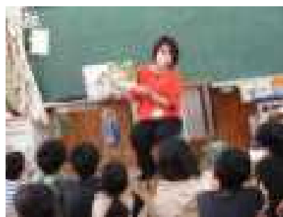
【ぐるんぱさんの読み聞かせ】