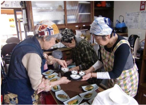
▲認知症カフェ「たからちゃん」での活動風景（2018年）