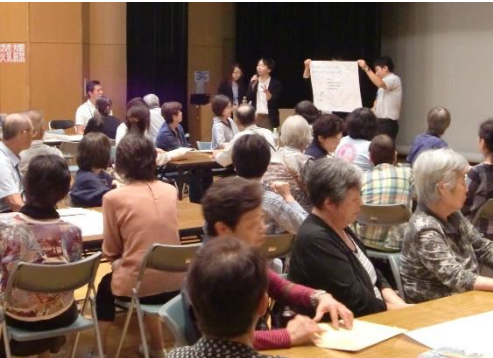
▲つどい場をテーマにした講演会（2017年）