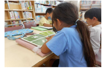
【しずかにせきで本をよむ】