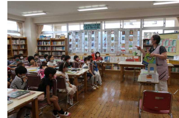
【かり方を教えてもらう】

1年生も貸出を始めています。図書時間に図書館のきまりや使い方を学習しましたので、次は自分で休み時間に来て借りることができるようになってほしいです!