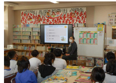
【本はお・も・し・ろ・い!】

また国語科の教科書に「図書館へ行こう」という教材がありますので、本のなかま分け(分類やラベル)の学習もいっしょに行いました。