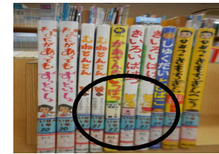
すいせん図書のシール