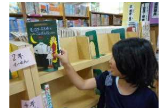
どんどん読んでくださいね