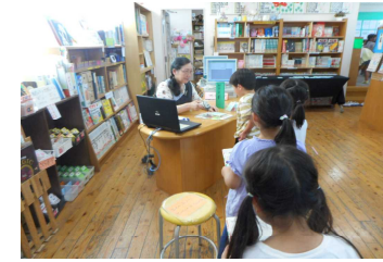
【カウンターで本をかりる】