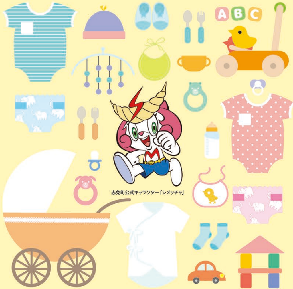
志免町公式キャラクター「シメツチャ」