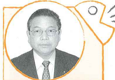
大西 勇 議員