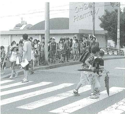
写真 集団下校で安全に