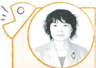
丸山 真智子 議員

ぎかい広報は紙面の都合上議会における発言の一部を抜粋し、要約して掲載しています。詳しく知りたい方は、各地域公民館、町内図書館、役場議会事務局で閲覧できます。