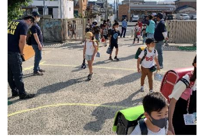
【当日のあいさつ運動】