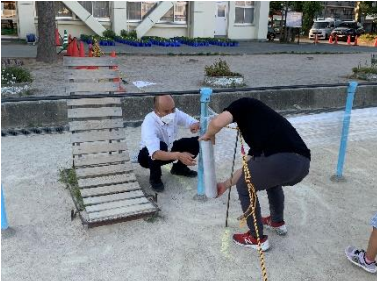
【立ち入り禁止区域設営】