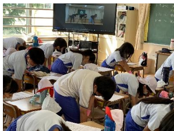
【おやじの会の方とラジオ体操】