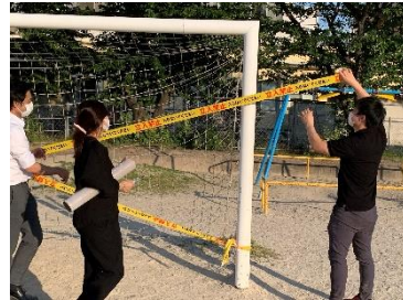
【遊具等のバリアード】