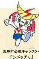
志免町公式キャラクター 『シメツチャ』