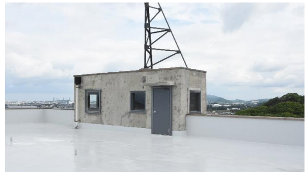
屋上塔屋、修理後。元の建具枠は残したまま、開口部を塞ぎました。防水工事も行いました