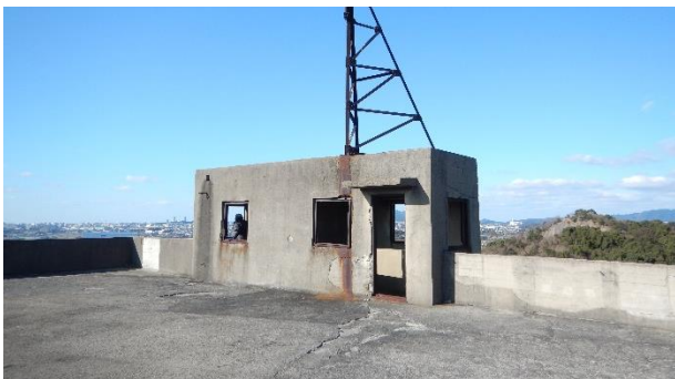
屋上塔屋、修理工事着手前の様子。扉や窓建具が失われ、雨水が建物内部に吹き込む状態でした