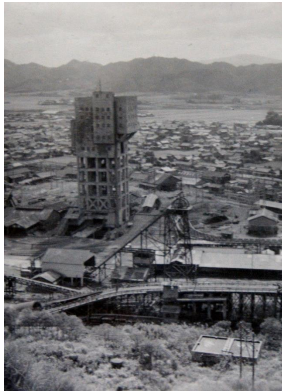
操業当時の竪坑櫓と鉱業所