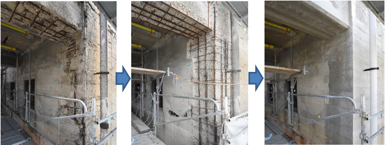
7階外壁、左：修理工事着手前の劣化状況、中：コンクリート劣化部研り完了、右：躯体補修完了。写真右手に写る雨水排水のための堅樋は、耐久性等を考慮してステンレス製に取替えました

令和2年度中にコンクリート躯体の補修の大半を終えました。躯体補修の後、屋上防水工事や、アルミサッシカバー工法による開口部の閉塞（はめ殺しガラス窓）を行っています。これは、コンクリート躯体への雨水の侵入を防ぎ、今後の劣化の進行を抑制し、建物の寿命を伸ばすことを目的としています。