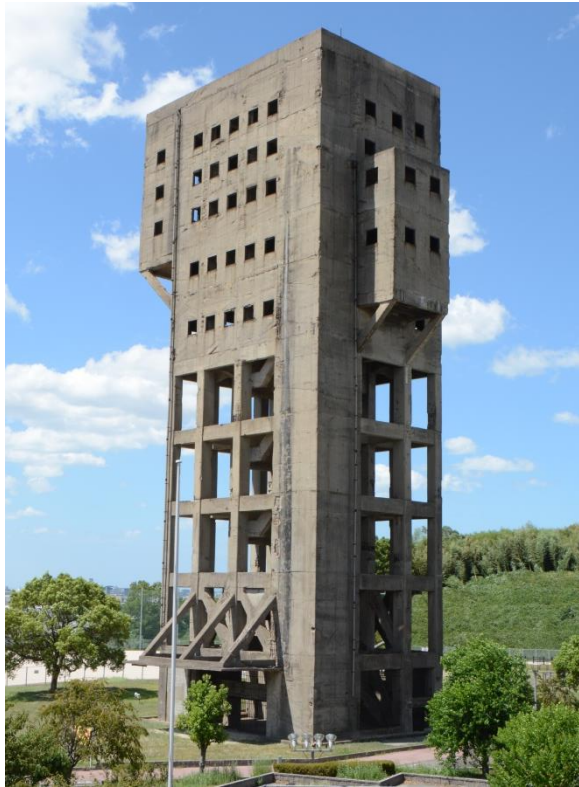
修理工事着手前の竪坑櫓

旧志免鉱業所竪坑櫓（きゅうしめこうぎょうしょたてこうやぐら）は建設から75年以上を経て、老朽化した部分の修理工事を行っています。このリーフレットでは竪坑櫓の歴史・概要と修理工事の概要を説明します。