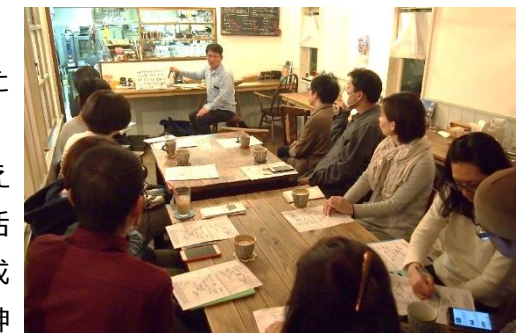
▲ 外部講師を招いた勉強会の様子

神話と歴史を学ぶ会は、志免町にある神社の文化と歴史を伝えるとともに、町民にとって神社が交流の場となることを目的に活動しています。現在30代～40代のメンバーを中心に、神社の成り立ちや伝承などを学ぶ勉強会を開催しており、今後は志免町の神社の歴史を広く知ってもらえたらと考えているそうです。