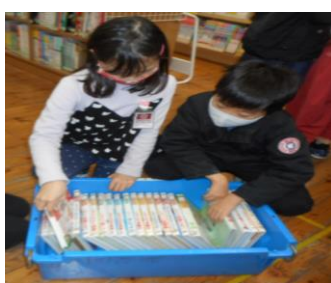
【図書館で本を選びテーマ決め】

じっさい しどう としょかん ししょ せつめい き 実際の指導は、図書館で、司書がします。説明を聞いた後、本を選び、読みながら課題を決めます。その後、教室で担任と一緒に自分の本のテーマや課題にそってノートの書き方を学習します。年間を通してやり続けることで、読む力、書く力、まとめる力など多くの力がつくと考えています。土・日の宿題となるとおもいます。応援下さい。