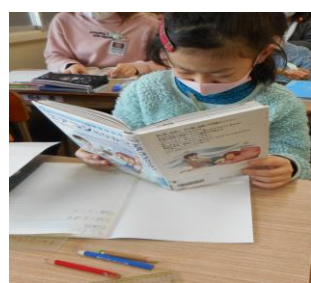
【本を読んで課題決め】