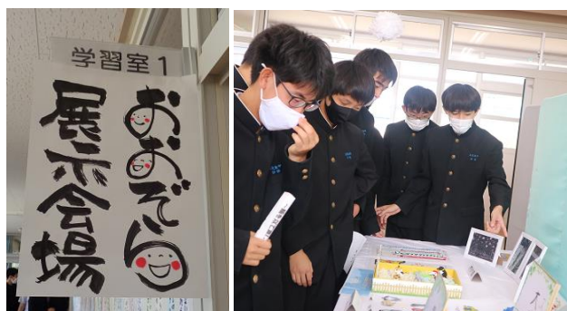
おおぞら学級の作品を鑑賞する様子

今回は、その一部を紹介します。なお、ホームページにも掲載しておりますのでご覧ください。