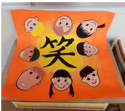
学級シンボルマーク