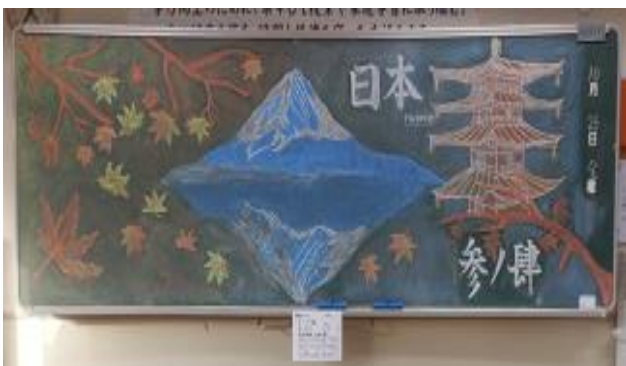
1日限りの黒板アート