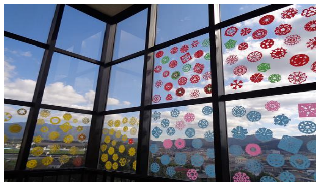
階段の窓ガラスと景色とのコラボ作品