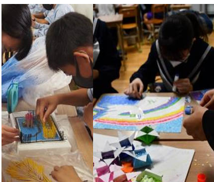
前日の準備の様子