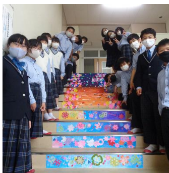
階段アートが完成し記念写真撮影