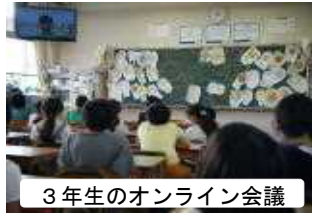
3年生のオンライン会議

お話を伺う一方向による学習を、6年生は7/13(月)に「5年後の志免町についての“夢プラン”」を役場にいらっしゃる世利町長様に提言する双方向での学習を実施しました。三密を避けながらのこのような学習形態や、タブレット等を活用した学習が、今後どの学年でも実施されていくことになると思います。本校でも、年内にはタブレットが一人一台導入されます。子どもたちの学びをより確かなものにできるよう、私たち教職員もICTを活用した効果的な指導方法についての研修を深めていきます。