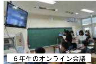
6年生のオンライン会議

また、本日の全校朝会(放送朝会)で、明日から始まる「夏休みの過ごし方」について、以下のような「 3つの夏休み 」のお話をしました。