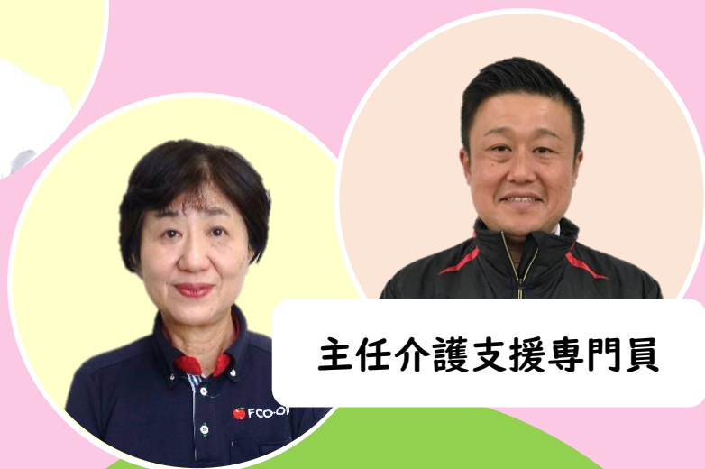
主任介護支援専門員