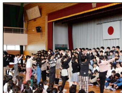
【ありがとう集会】～ありがとう～ 6年生へこれまでの感謝の気持ちを歌や呼びかけで伝えました。

3月14日（木）に、第150回卒業証書授与式を挙行政し、183名児童の新たな門出を祝いました。式の後、PTA主催でバルーン・リリースのイベントを実施しました。この日は天気がとてもよく、バルーンは青空に向かって空高く飛んでいくとともに、卒業生は未来に向かって小学校を後にしました。いよいよ5年生が最上級生となる日がきました。早速、クリーンアップ大作戦やグッド挨拶運動のボランティア活動を6年生から引き継いで活動している様子がありました。今後も子供たちの活躍を期待し、励ましの言葉を届けてください。