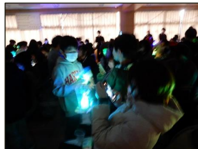
【おうちを彩るランプの製作】～あなたらしく～ 一人一人、自分なりにこだわって、伝えたいことを表現しました。