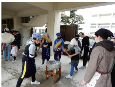
PTA おやじの会による6年生の「もちつき」

1月20日(土)にPTA おやじの会や地域の方々にご来校いただき、子供たちと共に次の活動を実施しました。5年生は地域の方と「どのような地域をつくりたいか」というお題で熟議をしました。6年生はもちつきを体験し、「ねばねばしていて、餅をつくのは難しい。がんばるしかなかったです。」と感想を言っていました。人との関わりの中で、子供たちの思いが深くなっています。