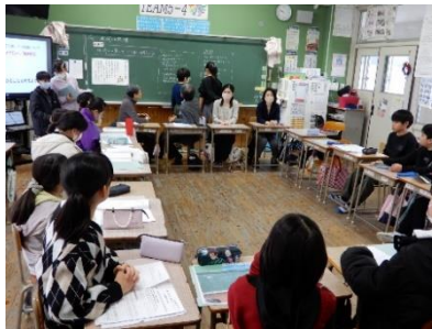
5年生と地域の方々で熟議を実施