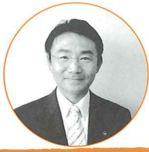
吉田 耕二 議員