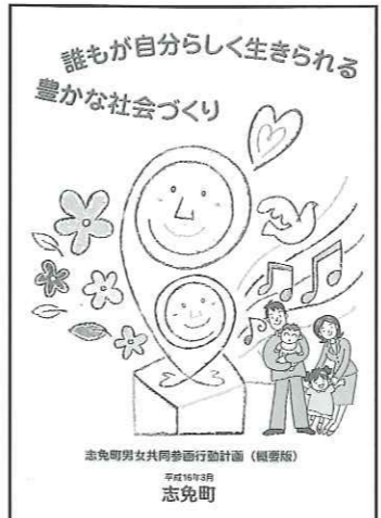
写真 志免町男女共同参画行動計画