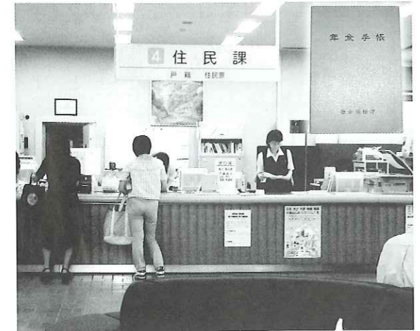
写真 年金記録の確認を