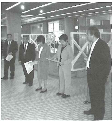
写真 市川市の中央図書館を視察

埼玉県志木市(面積9㎡キロ・人口6万8000人)は住民参加型の行政パートナー制度「市民との協働による行政運営推進」条例により、市がパートナーシップ協定を結んだ市民や団体に業務委託し、市民は知識と経験を提供。市は委託料を払って協働でまちづくりをしている。 本町も町立図書館と各430事業を廃止、縮減、見直しを行い12億7000万円の削減が行われた。 千葉県市川市は公立図書館と全小・中・高・養護学校、幼稚園が連携しひとつの大きな図書館を形成している。 学校図書館単独では蔵書に限りがあるが公立図書館と各学校図書館が連携することで市全体で蔵書数が140万冊と大きな図書館を持ったことと同じになる。