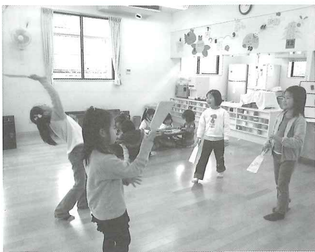
写真 手づくりの羽子板で羽根付、中央学童保育所