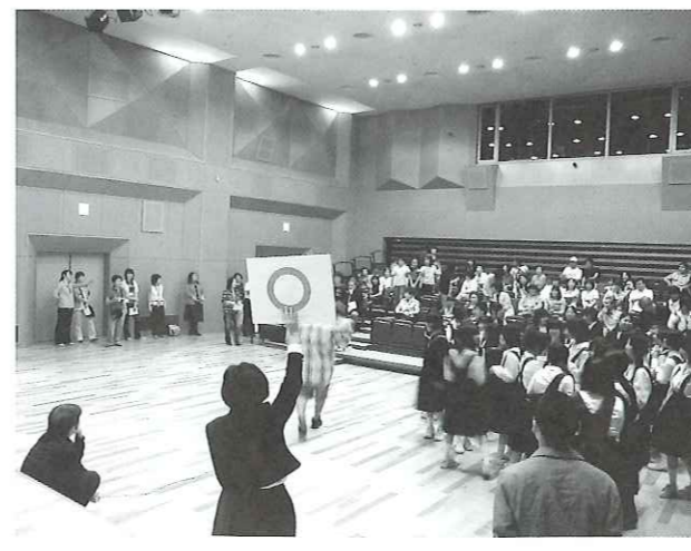
写真 「集まれ10代」で子ども参加