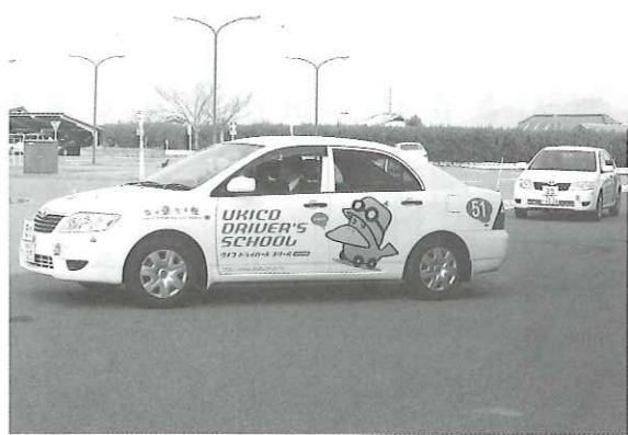
写真 高齢者を試験場までバス移送を

町長 運転免許試験場を粕屋署内に誘致する署名活動では志免町では二万人の賛同者が得られたと聞いている。すぐの実施は困難だが代替案として