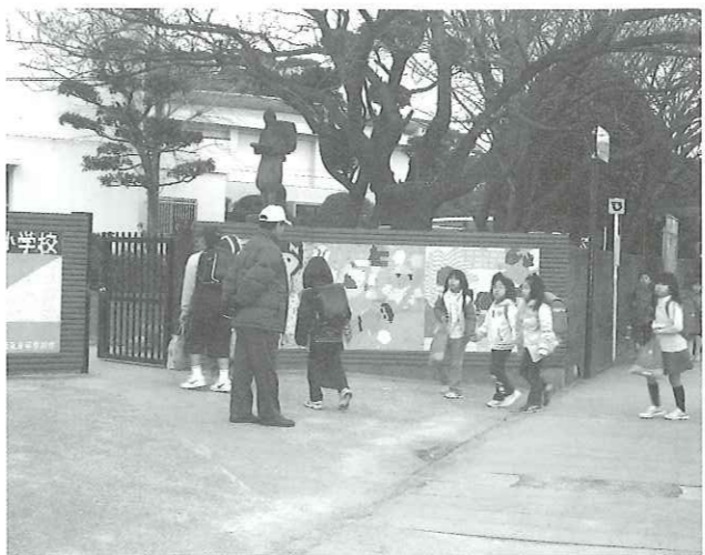
写真 おはよう!! 西小学校の登校風景

児童・生徒の命を守る取り組みについて、本町でも深刻に受けとめ、いじめは決して許さない。またどの学校でも起こり得るという認識に立ち各