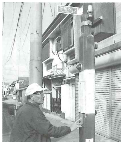
写真 東校区に設置されたお助けボタン

大熊 埋め戻す前に調査しておけば。 建設課長 まだほかに対応策があるかどうかも含めて、考えていきたいと思う。 ルのすき間がないように、とんどがシャッターが閉整備すべきではないのか。まってる。 建設課長 危険箇所等につきましては、地域の方々の意見を聞きその対策、点検を今後ともしていきたいと思う。 何か対策をされたことがあるのか。 町長 環境を整え、安全安心なまちづくりにつなげていくのが重要な課題。プロジェクトを立ち上げて検討したいと思う。