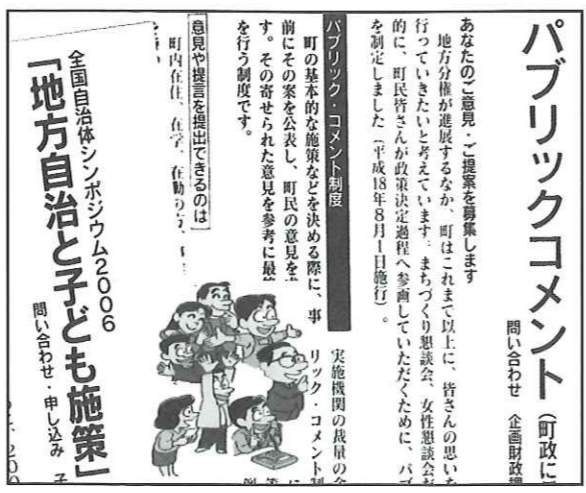
写真 町民への説明責任は

二宮 パブリックコメント制度要綱の説明を。企画財政課長 町民生活に深くかわりのある町の基本的な計画の策定に当たり町民の意見提出の