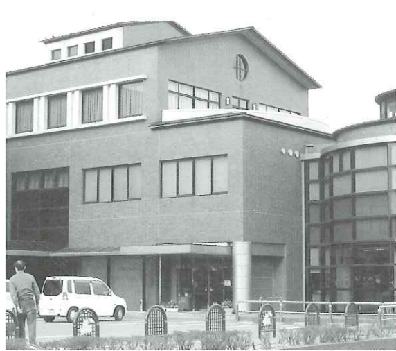
写真 業務管理委託契約の改善は

企画財政課長 端土地でも町有地を売るといふことから、町内の同意は必要だと思っている。