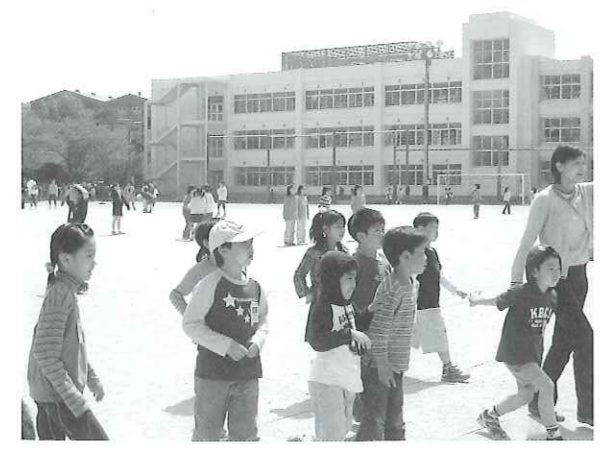
写真 いじめのない学校めざして

希望のグランドゴルフやスケボーなど若者の居場所作りに資するものがないか検討したい。