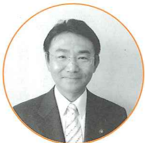
吉田 耕二 議員