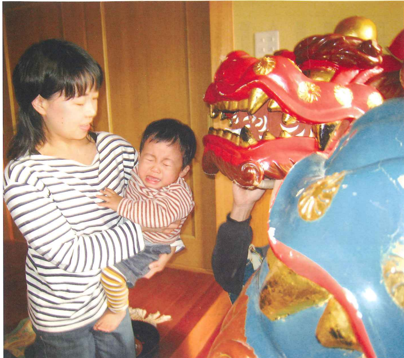
「泣く子は育つ」 伝統ある吉原地区獅子舞