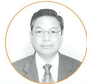
大西 勇 議員