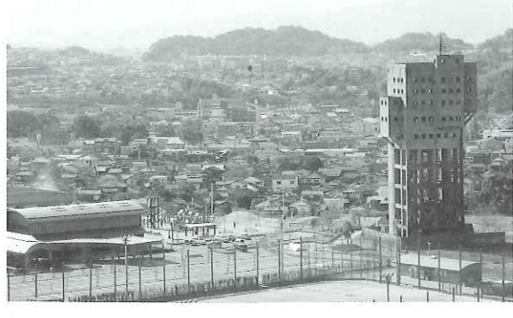
写真 壱坑を世界遺産に