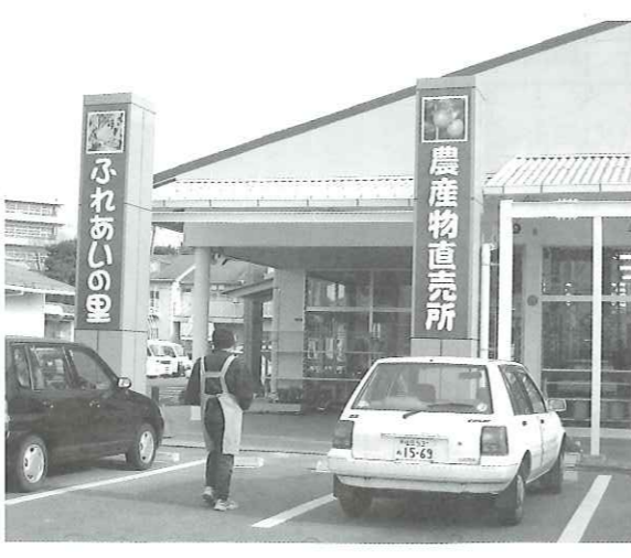
写真 商・工・農・他団体まとめて町おこしを