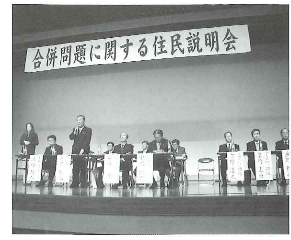
写真 平成16年に行なわれた説明会

それから平成19年9月をめどに法定協議会を設置する。そのため来年1月より各町1人の職員を派遣し、郡内に事務局を設置するとの確認を行っている。