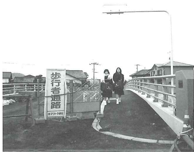
写真 開通間近の吉原橋

事業主体は福岡県だが認可以来一部の用地売却は勧められたが停滞した状況が続いている。志免、宇美地元行政の強力な支援のもと早期打開と推進を要請。