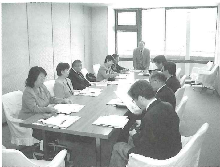
写真 議会運営委員会

一般質問については、14人より質問通告があり12月11日より13日迄の3日間とした。 陳情、意見書については、安全・安心の医療と看護の実現のため医師、看護師等の増員を求める陳情書が1件、「法テラス」のさらなる体制整備・ 充実を求める意見書(案)が1件提案される予定。議員提案として志免町議会の定数を定める条例の一部を改正する条例の制定についての定数削減案が提案されます。 当委員会としては、全員協議会を開催し議論する意見と、特別委員会を設置しての議論の意見もあり、特別委員会を設置することに決定した。