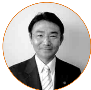
吉田 耕二 議員