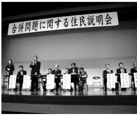
写真 平成16年に行なわれた説明会