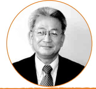
古庄 信一郎 議員

古庄 堅坑櫓の国・文化財認定の見込みは。 教育長 今年度内に。 古庄 私は志免堅坑櫓を活かす住民の会を設立し、各機関と九州伝承遺産ネットワークを立ち上げ近代化遺産の評価向上と世界遺産への活動をしてきた。今回世界遺産推薦の九州山口の近代化遺産群のサブリストに堅坑櫓が載った。世界遺産に道が開けるならば行政として努力すべきだが。 町長 堅坑櫓の値打ちを改めて認識した。安全性も確保したので、九州の産業遺産群の中でさらに世界遺産の可能性を持つ