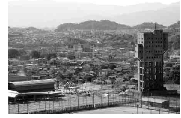
写真 堅坑を世界遺産に

町長 新たに一校新設か 西小学校児童数増 地域安全コンパス 大熊 地域の防犯を考えたのか。 町は帽子やワッペン、腕章をつくってあるが、町内で一生懸命頑張っている町内に対して、お助けボタンをつける予算を検討してはどうか。 町長 特にお助けボタンということでございますが、私は詳しくはこのお助けボタンというのを知らない。 総務課長 実績があれば今後、総合的に予算化の問題も含めて検討させていただきます。