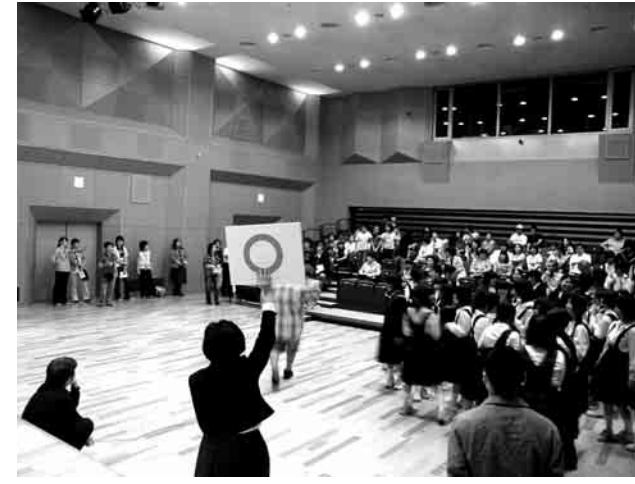
写真 「集まれ10代」で子ども参加