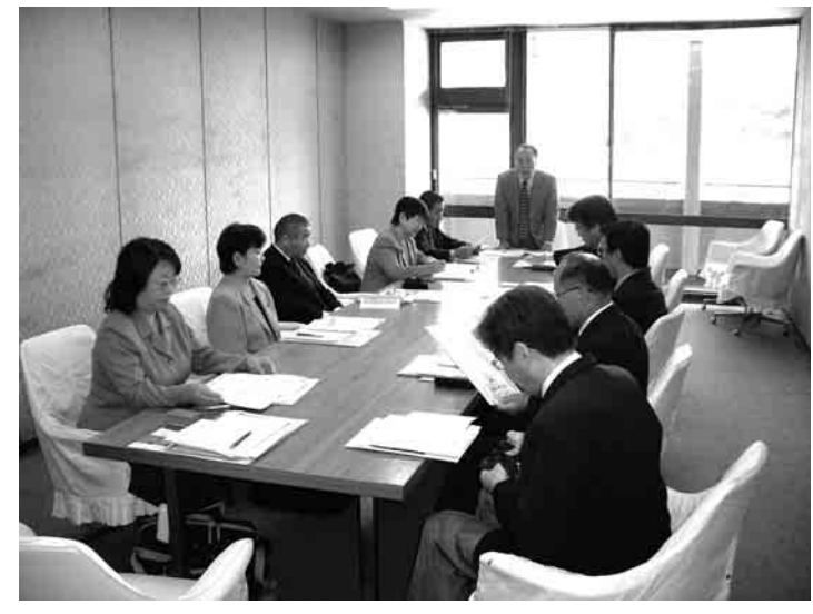
写真 議会運営委員会

一般質問については、14人より質問通告があり12月11日より13日迄の3日間とした。 陳情、意見書については、安全・安心の医療と看護の実現のため医師、看護師等の増員を求める陳情書が1件、「法テラス」のさらなる体制整備・ 充実を求める意見書(案)が1件提案される予定。議員提案として志免町議会の定数を定める条例の一部を改正する条例の制定についての定数削減案が提案されます。 当委員会としては、全員協議会を開催し議論する意見と、特別委員会を設置しての議論の意見もあり、特別委員会を設置することに決定した。