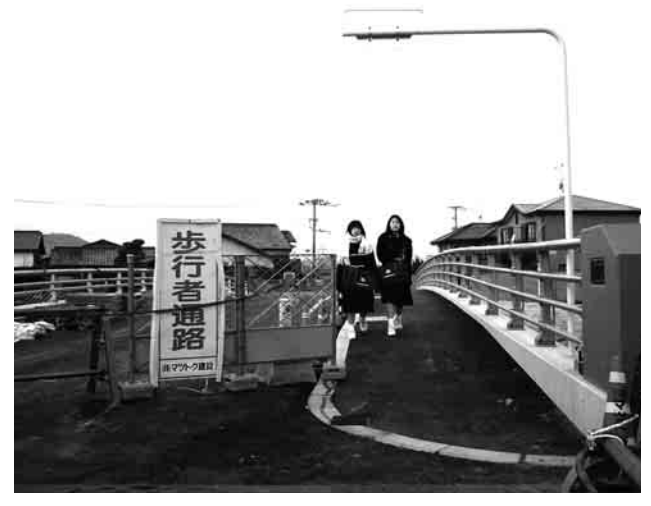
写真 開通間近の吉原橋

事業主体は福岡県だが認可以来一部の用地売却は勧められたが停滞した状況が続いている。 志免、宇美地元行政の強力な支援のもと早期打開と推進を要請。