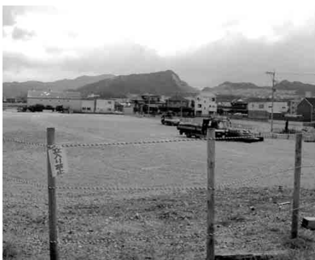
写真 辰元コンクリート跡地

志免区域に5階建て24世帯の賃貸マンション建設予定。志免町の人口増加が予測され、今後県道及び町道の整備が必要になってくる。