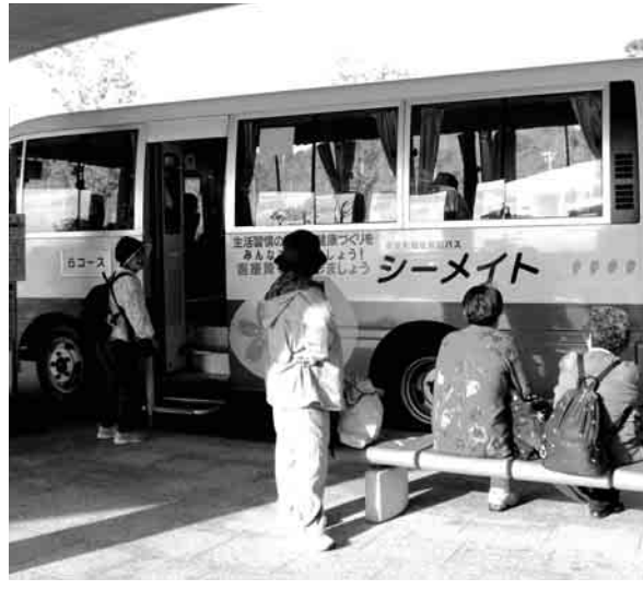
写真 乗りおりは気をつけて