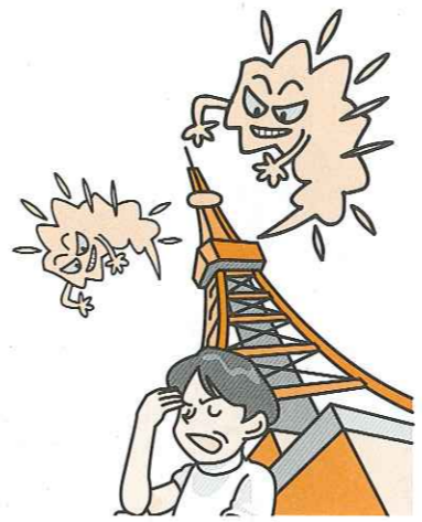
奇形植物と健康被害は全国で発生している

助村 欧米諸国では電磁波で脳腫瘍や白血病の危険性が指摘されており、電磁波問題は21世紀の公害と言われている。日本の電磁波規制は欧米諸国に比べると100倍から1万倍も甘く何の規制もないので住民は不安を感じている。 助役 危険の可能性があることについては予防の原則に立って対応をすべきで疑わしきは善後策をとるの思いはする。 建設課長 電磁波が健康に及ぼす影響については調査段階、今後国、県の動向を見ながら影響について配慮したい。町独自にできる要綱や企業との協定等対策を講じたい。