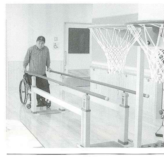
写真 リハビリテーション

おり支援を続けるのか。 福祉課長 4月から利用者の方々の利用1割負担を求めていくが、サービス提供内容によっては現存のサービスも引き続き行われていくことになり、ますので、全く変更はなく現行どおりに行われると考えている。