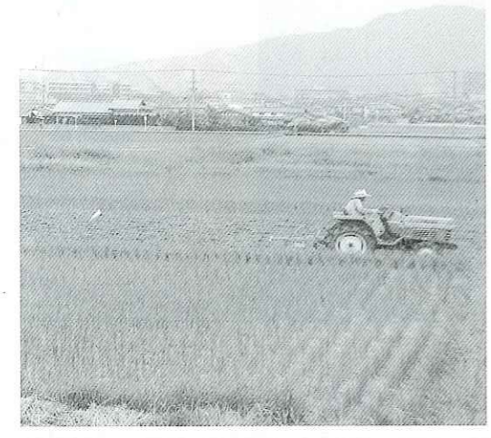
写真 稲作風景(吉原地区)

池邊 主に市街化調整区域が多い、吉原農区と周辺農区の農業者が願っている市街化区域への見直しにどのように取り組まれているのか。