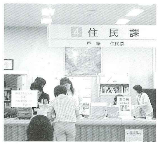
写真 窓口申請の簡略化